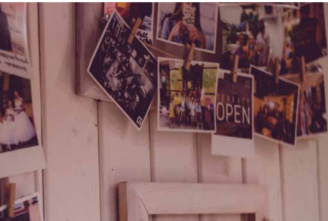
PHOTO BOOTH BORNE PHOTO

Immortalisez votre événement avec nos animations photographiques !